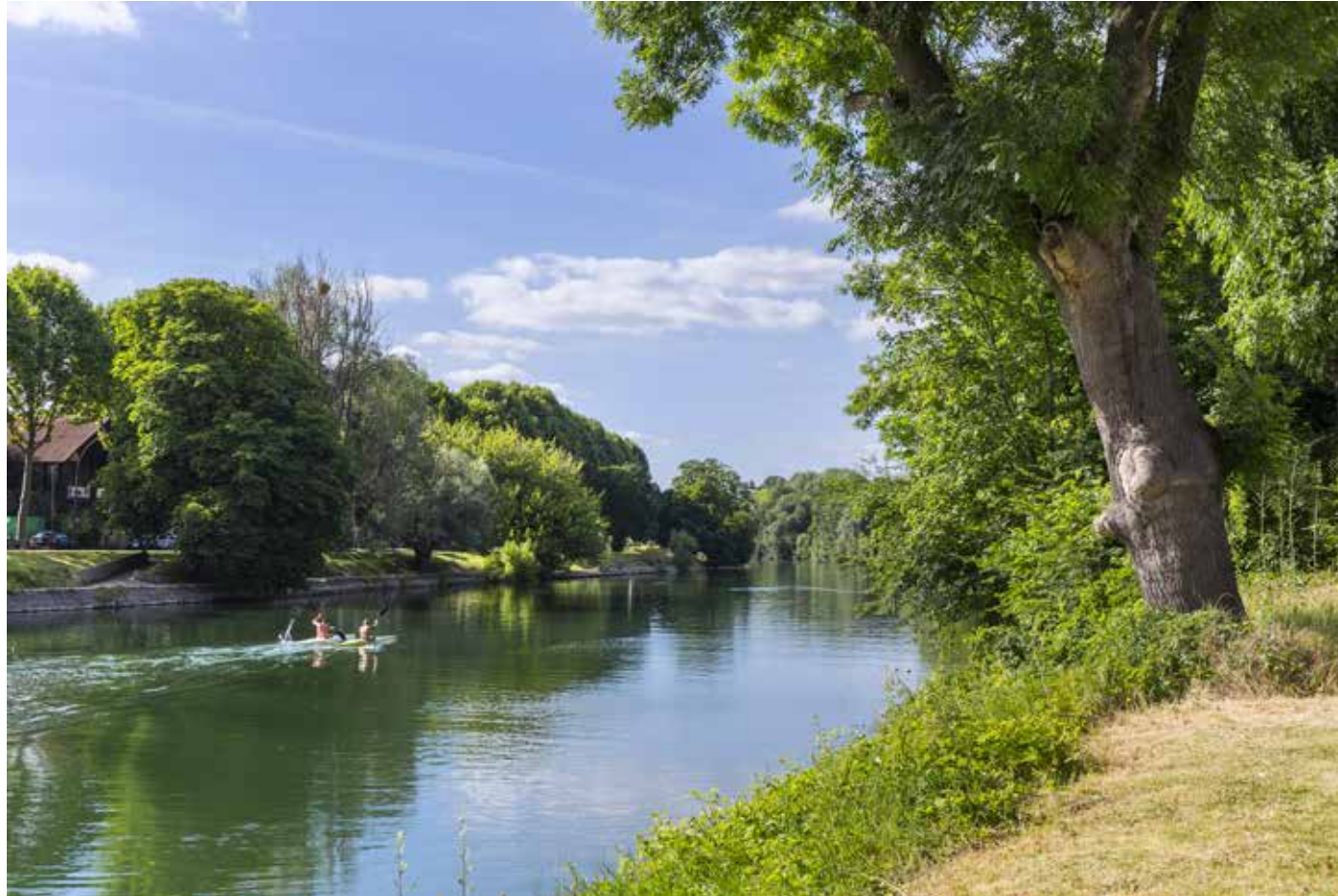
Chennevières-sur-Marne, une ville agréable et verdoyante située en bord de Marne