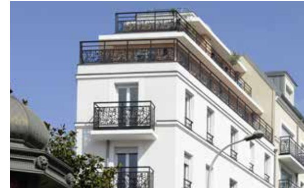
Côté Ville - Le Perreux-sur-Marne Architecte : Lionel de Segonzac