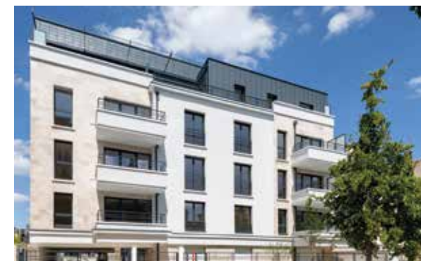
Villa Flora - Fontenay-sous-Bois Architecte : A2D Architecture