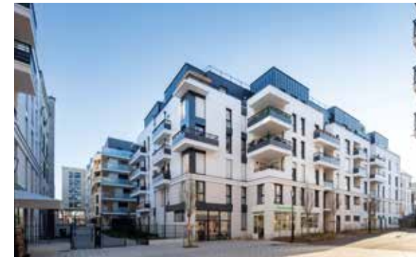
26 rue de Paris - Joinville-le-Pont Architecte : Smaïn Barkat